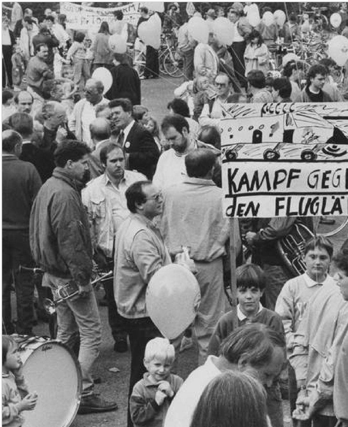
Eine Bürgerinitiative kämpfte gegen den Fluglärm.

Ein kurioser Unfall aus der Zeit des Kalten Krieges ist in dem Film von Andrej Bockelmann auch dokumentiert. So weist der Filmemacher auf eine Schleifspur auf der Heinsberger Straße in Wildenrath (alte Bundesstraße 221) hin, die daran erinnerte, dass dort 1979 ein Sattelschlepper der Bundeswehr umstürzte und plötzlich mitten in Wildenrath eine Atomrakete im Vorgarten eines Hauses lag. „Es gab und gibt gute Gründe für eine Beunruhigung der Bevölkerung“, merkt Andrej Bockelmann dazu in seiner TV-Dokumentation an.